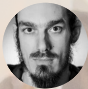
Simon Durocher-Gosselin | costumes et décors