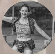
Annie-Claude Côté-Collin | décors